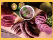
虹の森公園かごもり市場