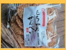
(有)ジェイ・ウィングファーム